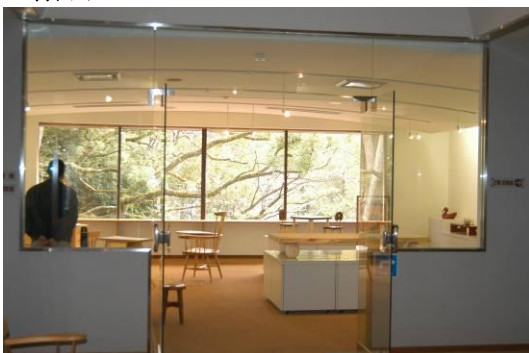
2階展示室B (今回の貸出はありません)